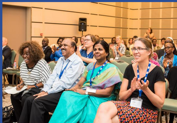
Asistentes a la AGA en un momento de la misma. Se observa la gran diversidad que reúne Oikocredit a nivel Internacional.

- Los gastos internos bajan significativamente respecto a años anteriores con altas subidas.