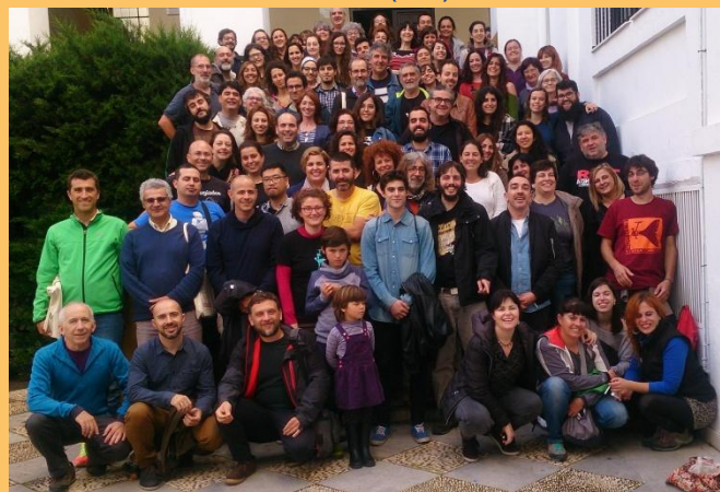
Participantes en Idearia Córdoba

Bajo el lema “ Por una economía que cuide la vida ” ha centrado esta edición en la economía feminista (EF).